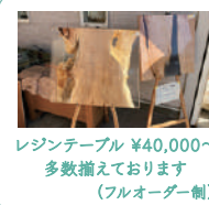
レジンテーブル ¥40,000～ 多数揃えております (フルオーダー制)