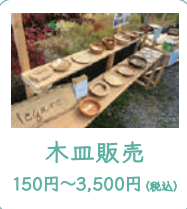
木皿販売 150円～3,500円 (税込)

※3時間を超える場合は、1,800円+1時間毎に550円追加になります。 ※材料の持ち込みは可能です。事前にお電話でお伝えください。